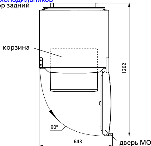
Рисунок 2 – Холодильник (вид сверху)