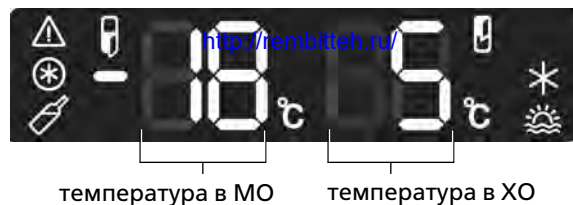
температура в МО